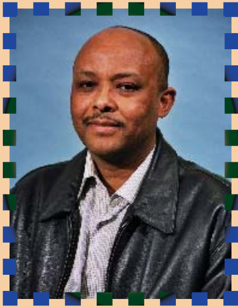
“በሞት ጥላ መካከል እንኳ ብሔድ አንተ ከእኔ ጋር ነህና ክፋን አልፈራም” መዝሙር 22:4

ይህንን የምስክርነት ቃል ለምታነቡ እህቶቼና ወንድሞቼ ሁሉ ጸጋና ሰላም ይብዛላችሁ ይህ ያለፈው ዓመት 2007 ማለት ነው አጀማመሩ ለኔ መልካም አልነበረም ነገር ግን ፍጻሜውን እግዚአብሔር መልካም አደረገው በማርች/2007 በድንገት ታመምኩኝ ከመኝታዬ መነሳት እስከሚያቅተኝ ድረስ ቃተትኩኝ ተነስቼም ለመሄድ ስምክር አቅምና ጉልበት ፈጽመው ከዱኝ ለመጀመሪያ ጊዜ በህይወቴ ተሰባሪ መሆኔን ተገነዘብኩኝ በዚህ ሁኔታ ላይ እንዳለሁ በሴንትፖል አካባቢ በሚገኘው የቅዱስ ዮሴፍ የህክምና ማዕከል ምርመራ መከታተል ጀመርኩኝ ነገር ግን የበሽታዬ መንስኤው ምን እንደሆነ ለማወቅ በጣም ተሳናቸው እኔም ከዕለት ወደ ዕለት ህመሙ እየጠነከረብኝ ስራ መሄድ ሁሉ አቃተኝ ጉልበቴም ደከመ ልቤም ከሚገባው በላይ መምታት ጀመረ እንቅልፍ ሳልተኛ ያደርኩባቸውን ቀናቶች መቁጠር እንኳን ተሳነኝ ለመጀመሪያ ጊዜ ብቸኝነት ተሰማኝ ተስፋ መቁረጥም ይታይብኝ ነበር በዚህ ሁሉ ውስጥ ግን የእየሱስን ስም ከመጥራት አላቋረጥኩኝም ነበር ጠዋት ስነሳ፣ ማታም ስተኛ አንተ ልትፈውሰኝ ይቻልሃልና እያልኩ ማልቀስ ጀመርኩኝ በእርግጥም ሞት በራፌ ላይ እንደሆነ ለመጀመሪያ ጊዜ ተገነዘብኩኝ ከፍርሃትም የተነሳ የምኖርበትን ቤት (Apartment) በሩን ክፍቱን ማሳደር ጀመርኩኝ ድንገት ብሞት እንኳ ለአካባቢው ሁኔታውን ለማመቻቸትና አስክራሬን በማሸተት ችግር እንዳይፈጠር ለማመቻቸት ማሰቤ ነበር በዚህ ሁኔታ ወሩ ተጠናቆ ወደ ኤፕሪል ተሸጋገርኩኝ ቢሆንም ከሃኪሞቹ ዘንድ አንዳችም ምላሽ አላገኘሁም በመጨረሻም ህመምህ ምን እንደሆነ ማወቅ አልቻልኩም በጣም ሙሉ ጤነኛ ነህ ስለዚህ በኛ በኩል የምንረዳህ ነገር የለም በማለት አሰናብቱኝ ሁኔታዬን በቅርብ ይከታተል የነበረ ወንድሜና ጓደኛዬ የሆነ ሰው በሮቸስተር ከተማ በሚገኘው የሜይ (Mayo Clinic) በህክምና ስለሚሰሩ ሊረዳኝ በሚችለው ሁሉ ጥረት በማድረግ ወደ እርሱ ዘንድ በአስቸኳይ እንድናመጣ አደረገኝ ከዚህ ሆስፒታል እንደደረሰኩኝ በአፋጣኝ መድከሜን ስለተገነዘቡ ተሯርጠው እንድተኛ ተደረገ ሌሊቱንም ደም ከተሰጠኝ በኋላ ለመጀመሪያ ጊዜ ያጣሁትን እንቅልፍ ተኝቼ አደርኩ።